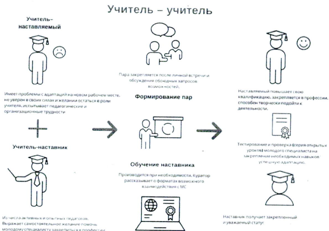
Рис.1 Форма наставничества «учитель – учитель»